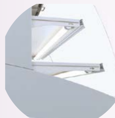
Eclairage LED dans les étagères