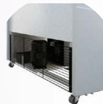
grille de protection du compresseur