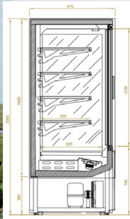
Arhus Groupe logé