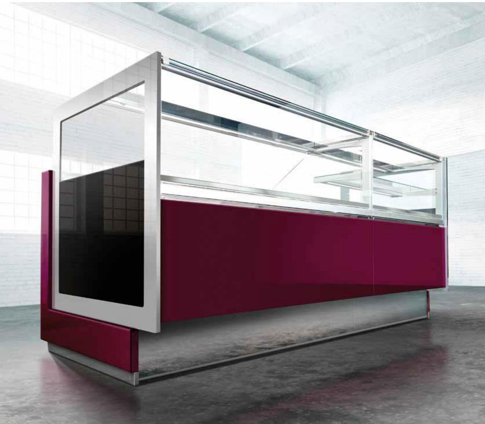
Pannello frontale e fianco terminale RAL 4004. 4004 RAL version for lateral and frontal panels.